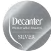
SILVER MEDAL DECANTER WORLD WINE AWARDS