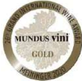
GOLD MEDAL MUNDUS VINI 2020